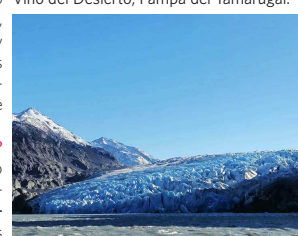
Glaciar Grey, Torres del Paine.