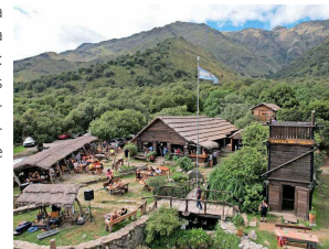
Cabeza del Indio, Merlo.