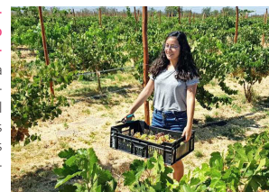
Vino del Desierto, Pampa del Tamarugal.