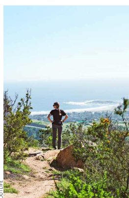
Desde el mirador El Secreto.